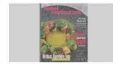
HOTEL RESTAURANT MAGAZINE HAZİRAN 2017 SAYISI