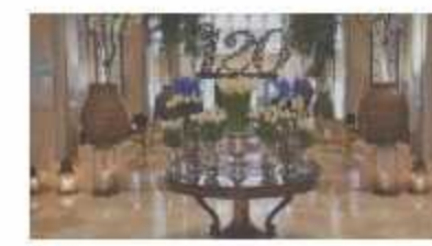
Kempinski 120. Yılıni Kutluyor!