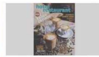
HOTEL RESTAURANT MAGAZINE MAYIS 2017 SAYISI